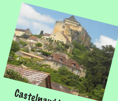
Castelnaud la Chapelle