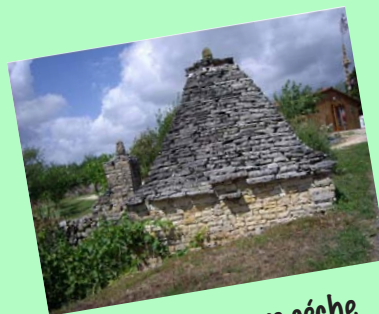
Cabane de pierre sèche

A pont Carral, traverser la route départementale et prendre la petite route qui monte en face, longer le mur en pierres et tourner à gauche sur le goudron, puis continuer sur le chemin jusqu'à l'Abbaye Nouvelle . A la route tourner à gauche, serrer à droite, puis à gauche. Tourner à gauche pour arriver devant l'Abbaye Nouvelle.